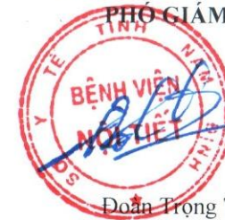
Đoàn Trọng Thuyết