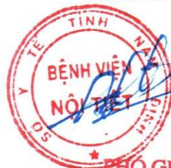
PHÓ GIÁM ĐỐC ĐOÀN TRONG THUYẾT