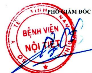
Đoàn Trọng Thuyết