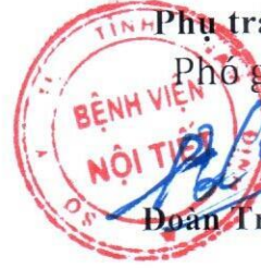
Đoàn Trọng Thuyết